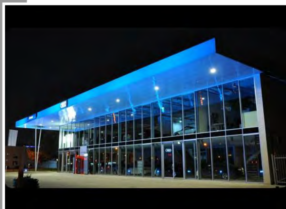
Illumination Shoow-Room Audi