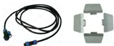
Options: Réflecteurs et Câbles ext.

Le Miriam GII (Deuxième Génération) est un produit architectural unique, il est dédié à l'éclairage de Facades , Monuments , Edifices... Il s'agit d'un produit 3-en-1 qui intègre dans son boîtier la partie alimentation et le contrôleur DMX. Sa mise en oeuvre est simplissime. 2 Versions sont disponibles: Un modèle en trichromie et l'autre en monochromie