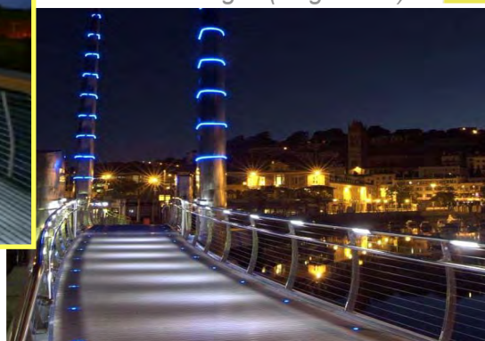
Pont de Diglis (Angleterre)