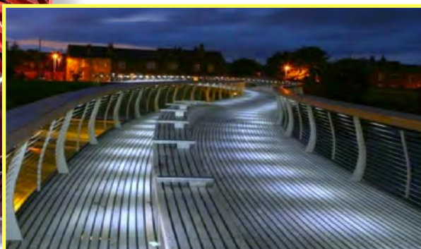
Passerelle Urbaine (Iles Canaries)