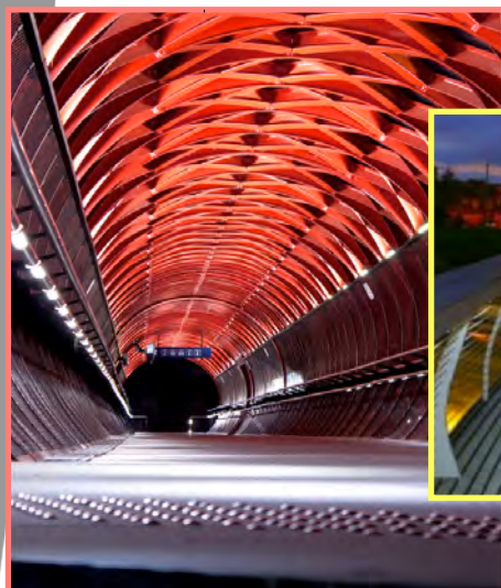
Passerelle La Roche/Yon (France)